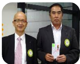
5月誕生月祝 高岡会員